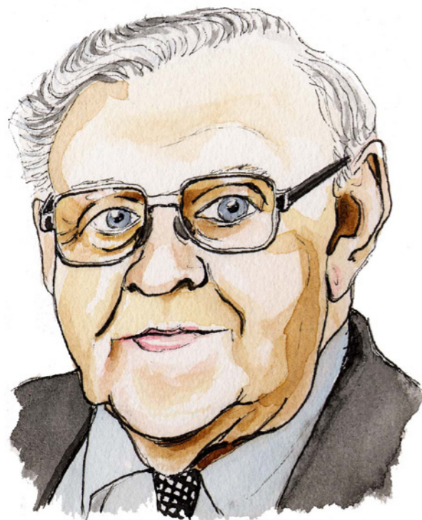
Matthías Bjarnason.