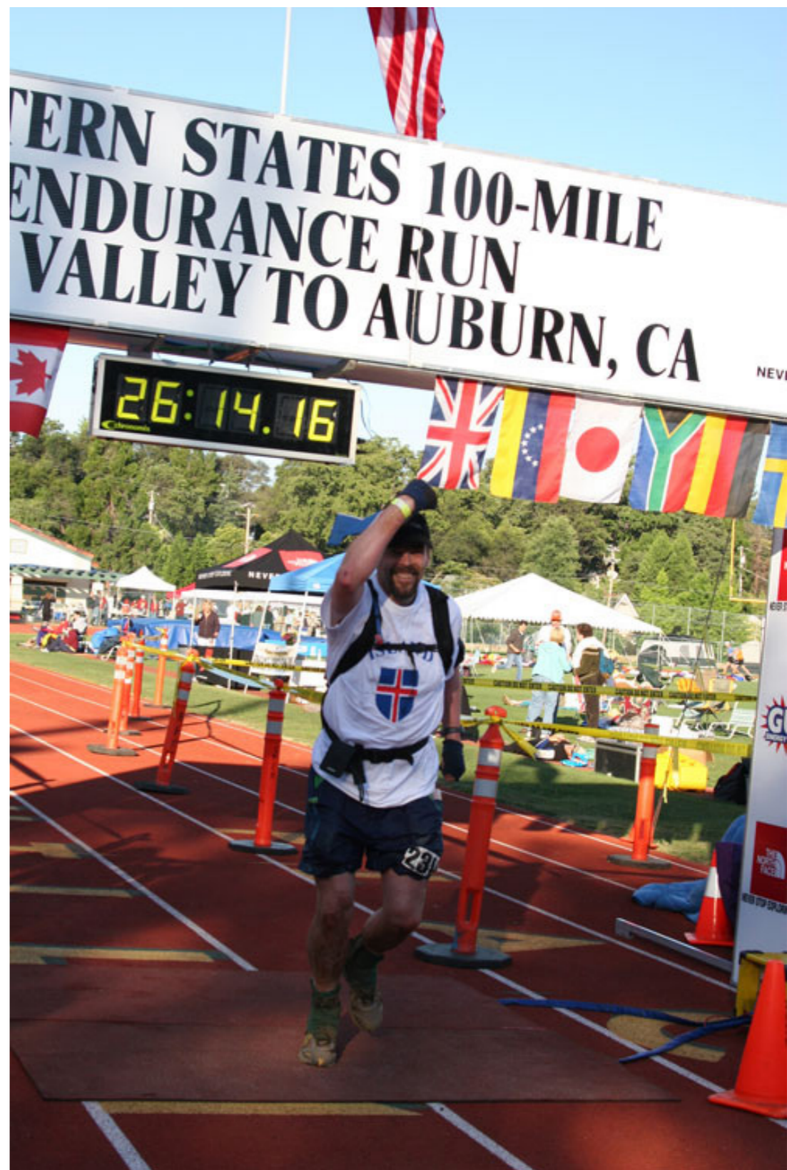
Komið í mark í Western State, 100 mílna hlaupi í Kaliforníu.