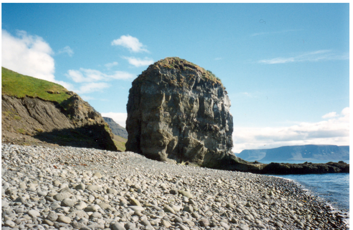
Stapinn á norðurströnd Arnarfjarðar. Þar er álfabyggð. Bryggjan þeirra til hægri. Hér munu margir ferðamenn staldra við.

Ef þörf krefur verði sett lög um þetta frá Alþingi.